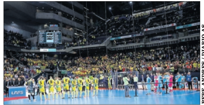
ESPECTACULAR. El WiZink Center lleno en la final de la Copa.

La Salobreja, cada partido sea una fiesta y en el WiZink Center demostraron que son capaces de hacer reaccionar al equipo, fue emocionante". Ahora, tras celebrar a lo grande el título copero, debe seguir dando su mejor versión para ganar minutos y seguir creciendo en uno de los equipos referencia de la LNFS.