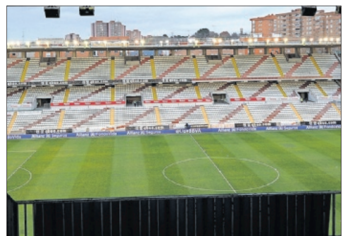
CAMBIO. En la primera fase, la Comunidad invertirá 1,8 millones.

Objetivo “Queremos mejorar la accesibilidad y retirar los elementos obsoletos”