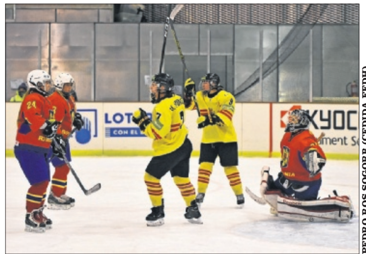
CAMPEONAS. España, tras su partido contra Rumanía.