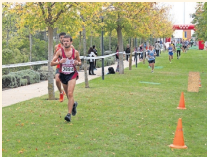
ATLETAS. Un corredor de la Complutense en Cross Universitario.

no que se disputarán entre el 21 y 23 de marzo. En el resto de deportes ya finalizados, destaca la hegemonía de la Politécnica que ganó cuatro de las seis competición que se han disputado. En esta edición destacó que el título de cada disciplina se jugó en una novedosa final a cuatro durante un fin de semana.