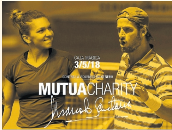
SOLIDARIO. Simona Halep y Feliciano López estarán en el torneo.

objetivo conseguir 100.000 euros. Ya han confirmado que estarán en este torneo tan especial Feliciano López y Simona Halep. "Me entusiasma la idea de que el evento benéfico previo al torneo lleve mi nombre. El formato de competición estoy seguro de que será un éxito", decía Manolo Santana, que, por supuesto, estará presente.