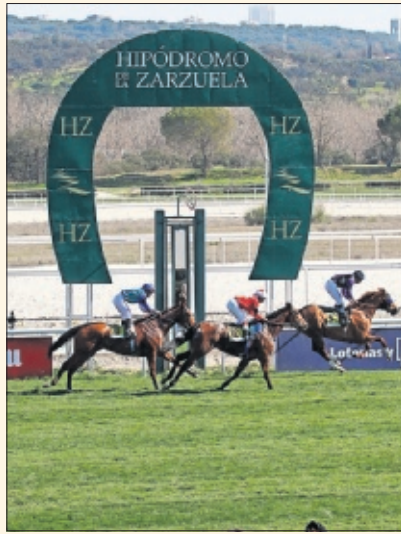
Carreras en La Zarzuela.