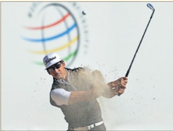
CON EL HIERRO. Rafa Cabrera Bello, en el Mundial de match play.

Madrid tras varios años de ausencia y en un campo público. Así que son buenas noticias para España", decía el gran canario, con tres títulos como profesional inmerso en el Mundial de match-play en Austin y que llegará directo desde el Masters de Augusta. Queda por confirmar si Rahm y Sergio, las otras estrellas nacionales, estarán en Madrid.