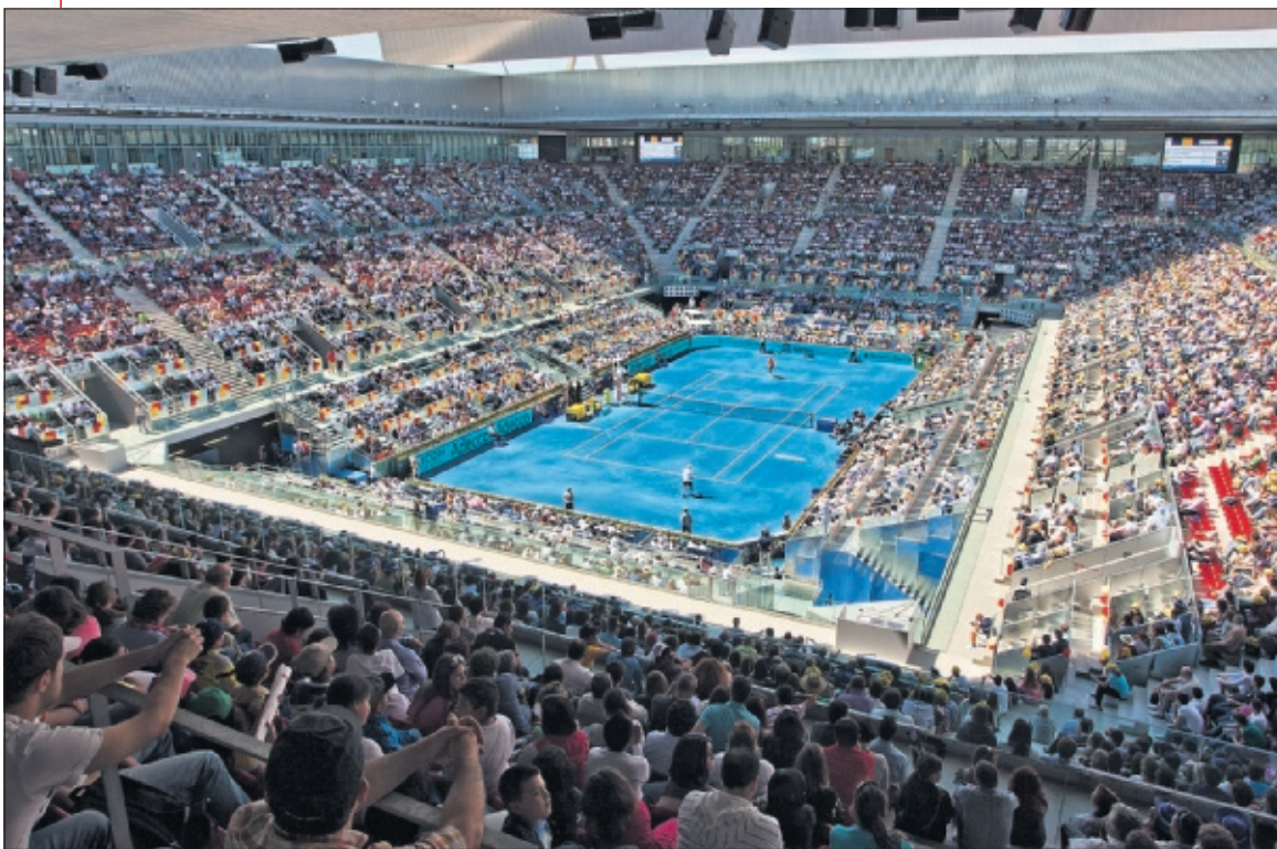
Vista panorámica de la pista Manolo Santana, en la Caja Mágica, durante un partido del Madrid Open.

Diario AS | viernes, 8 de noviembre de 2019