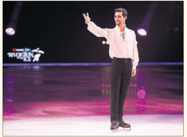
Javier Fernández, en Revolution on Ice en Madrid.

“Tratamos de innovar con elementos nuevos, cambiamos detalles, porque queremos que el espectáculo siempre sea algo diferente”, explica Javier Fernández, siete veces campeón europeo, doble oro mundial y bronce olímpico, que ahora es uno de los showman más prósperos del patinaje universal. Es Superjavi, carisma y talento.