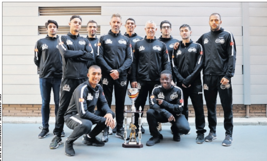
El equipo Emporio Valenciano de boxeo visitó la redacción con la Copa de campeón de Liga.