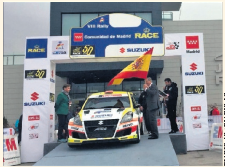
Una edición anterior del Rally de la Comunidad de Madrid.