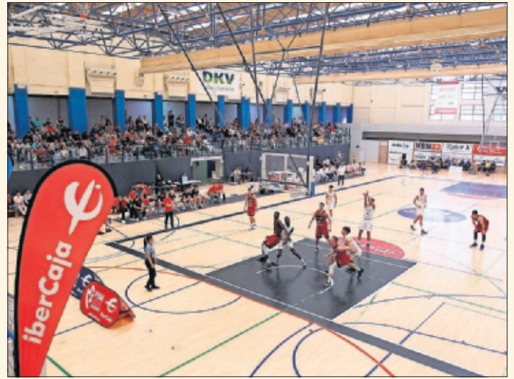
Un Fuenlabrada-Madrid de baloncesto de categorías inferiores.

También el fútbol femenino, mediante la campaña SÚMATE, impulsada por la Federación Madrileña, ha conseguido duplicar los equipos en menos de tres años. En 2016/17 había 157 y en esta campaña 2019/20 se esperan hasta 310 equipos de la región.