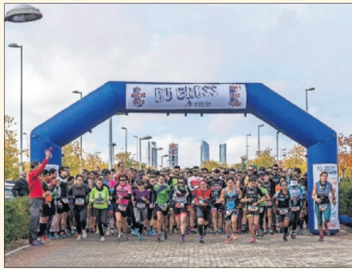
La salida de la prueba de Madrid del circuito Du Cross.

más emoción e intensidad a la prueba. Allí se terminarán de perfilar las clasificaciones y a su término se hará entrega de los correspondientes premios anuales. Con un límite de 300 dorsales, las inscripciones a precio reducido se pueden realizar hasta el miércoles anterior a la prueba en www.ducross.es , con descuentos para desempleados y clubes. —ORIHUELA